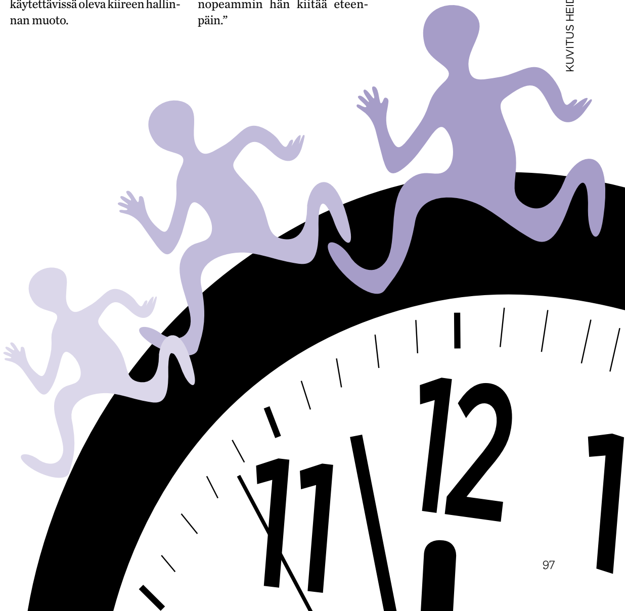
KUVITUS HEIDI KORHONEN

Seitsemäs syy on protestanttisen työetiikan puristus . Protestanttisen etiikan mukaan oma ihmisarvo on hankittava päivittäin suorittamalla. Jokainen minuutti täytyy olla tehokas. Laiskottelu on paheellista.